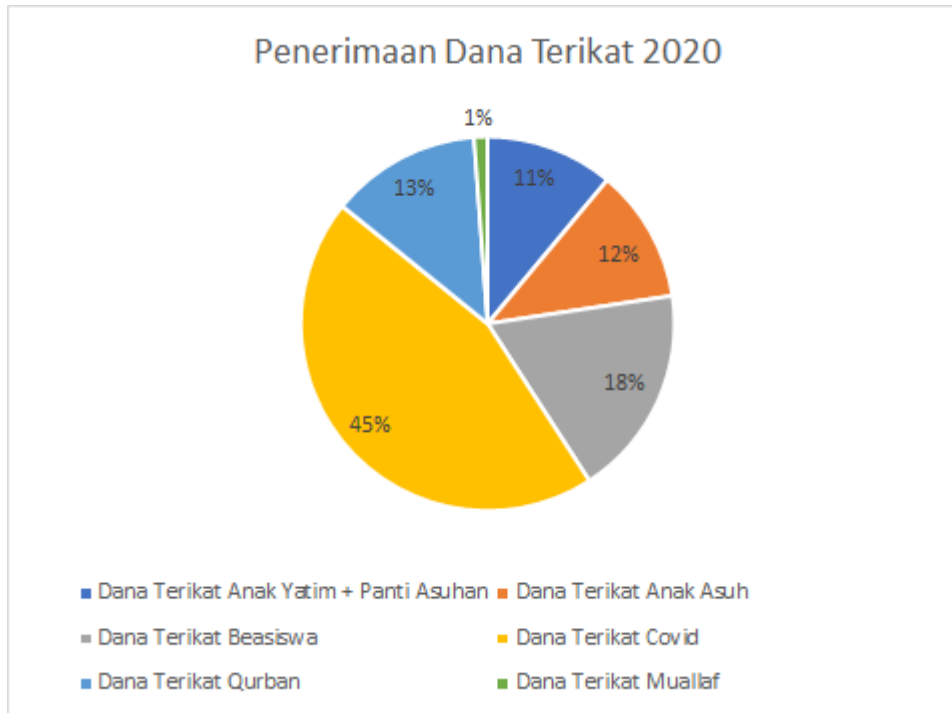
Gambar 1.2 Grafik Penerimaan Dana Terikat UPZ UGM

Berdasarkan grafik di atas, penerimaan dana terikat terbesar berasal dari dana terikat COVID-19. Disusul oleh dana terikat beasiswa, dana terikat qurban, dana terikat anak asuh, dana terikat anak yatim dan panti asuhan dan yang terakhir dana terikat muallaf. Dana terikat COVID-19 menjadi yang terbesar karena memang di masa pandemi ini, aliran bantuan begitu cepat dan respon serta kepedulian masyarakat untuk saling membantu terus meningkat. Dana terikat muallaf menjadi yang terendah pun karena kebutuhan untuk para muallaf pun tidak terlampau besar dan penyaluran santunan muallaf merupakan aktivitas yang rutin dilaksanakan oleh R-ZIS UGM setiap bulannya.