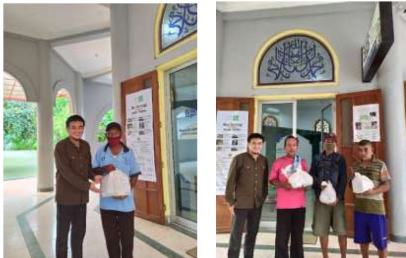
Gambar 1.11 Penyaluran Sembako KOPMA UGM untuk Tukang Becak Kampus UGM

Jum'at, 22 Mei 2020 R-ZIS UGM menyalurkan bantuan sembako kepada tukang becak di sekitar kampus UGM sebanyak 4 paket sembako dari KOPMA UGM. Tukang becak ini merupakan salah satu dari sekian profesi yang terdampak COVID-19 secara signifikan. Sehari-hari mereka menunggu penumpang di sekitar bundaran UGM. Namun semenjak pandemi, penumpang pun sepi sehingga membuat penghasilan yang di dapat menurun.