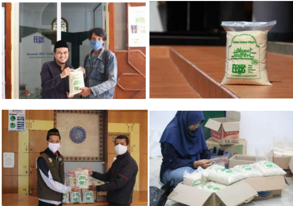
Gambar 1.14 Pengemasan dan Penyerahan Paket Zakat Fitri Ke Takmir Masjid

Sabtu, 23 Mei 2020, R-ZIS UGM telah menyalurkan Zakat Fitri kepada mustahik di daerah Yogyakarta. Diantaranya, dhuafa di Desa Argomulyo, dhuafa di Desa Sambirejo, dhuafa tunanetra, tunadaksa, muallaf, serta warga dhuafa sekitar kampus UGM. Total penerimaan zakat fitrah dalam bentuk uang di Ramadhan 1441 H yaitu sebesar Rp10,488,000.00 dari 291 orang. Untuk zakat fitrah dalam bentuk beras terkumpul sebesar 108 kg dari 36 orang.