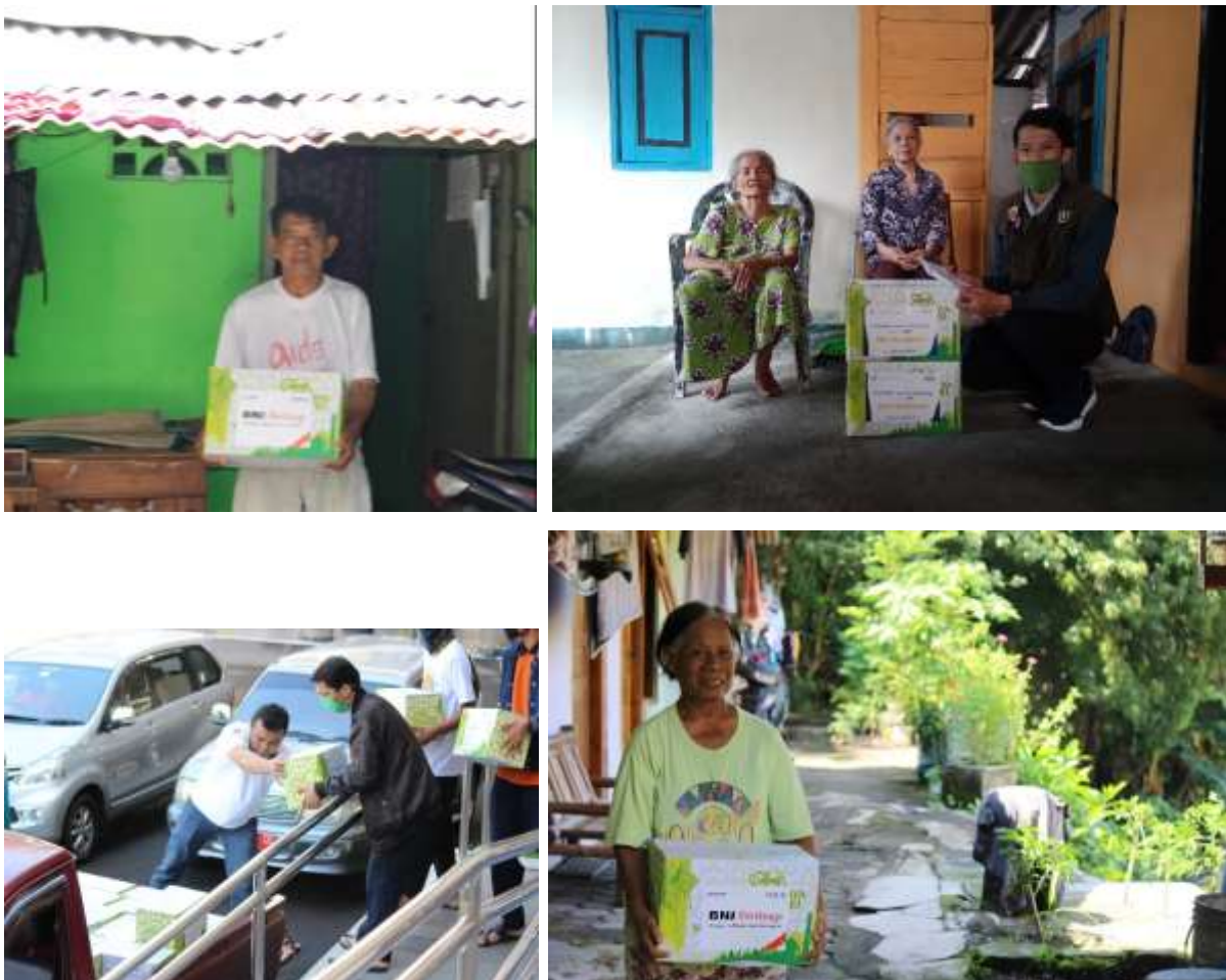
Gambar 1.13 Penyaluran Bingkisan Lebaran dari BNIS ke dhu'afa sekitar UGM

Sebagai kampus yang memiliki kepedulian tinggi terhadap persoalan COVID-19 ini, UGM terus mengupayakan pelbagai bantuan bagi masyarakat Indonesia, khususnya DIY. Lewat kerja sama dengan BNI Syari'ah, UGM memberikan 195 paket bingkisan lebaran untuk masyarakat yang membutuhkan di DIY melalui R-ZIS UGM. Paket tersebut disalurkan oleh R-ZIS UGM kepada dhu'afa di sekitar kampus UGM pada hari Rabu, 20 Mei 2020 secara serempak dibantu oleh civitas akademica UGM dan Relawan R-ZIS UGM.