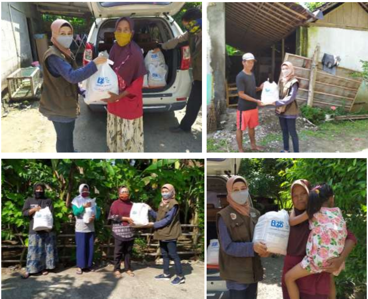
Gambar 1.12 Penyaluran Paket Sembako COVID-19 Untuk Warga Sanden, Bantul

Tepat pada Sabtu, 01 Mei 2020, beberapa staff R-ZIS UGM menyalurkan bantuan kepada gharimin di daerah Sanden, Bantul sebanyak 18 paket sembako. Penyaluran sembako ini dapat terlaksana dengan baik atas kerja sama R-ZIS UGM dengan salah satu wartawan di kantor media online Suara Djogja.com, yakni bapak Ponijan. Oleh karena itu, penyaluran sembako di Sanden ini dimuat pula beritanya di Suara Djogja.com.