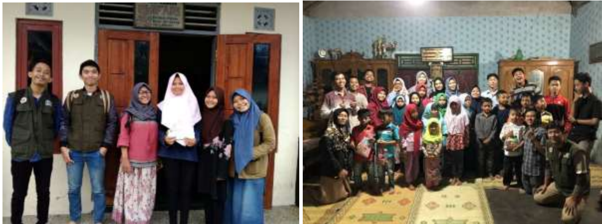
Gambar 1.7 Penyaluran Beras dan Santunan Panti Asuhan

Adapun beberapa panti asuhan yang menjadi tempat penyaluran dana R-ZIS adalah sebagai berikut: