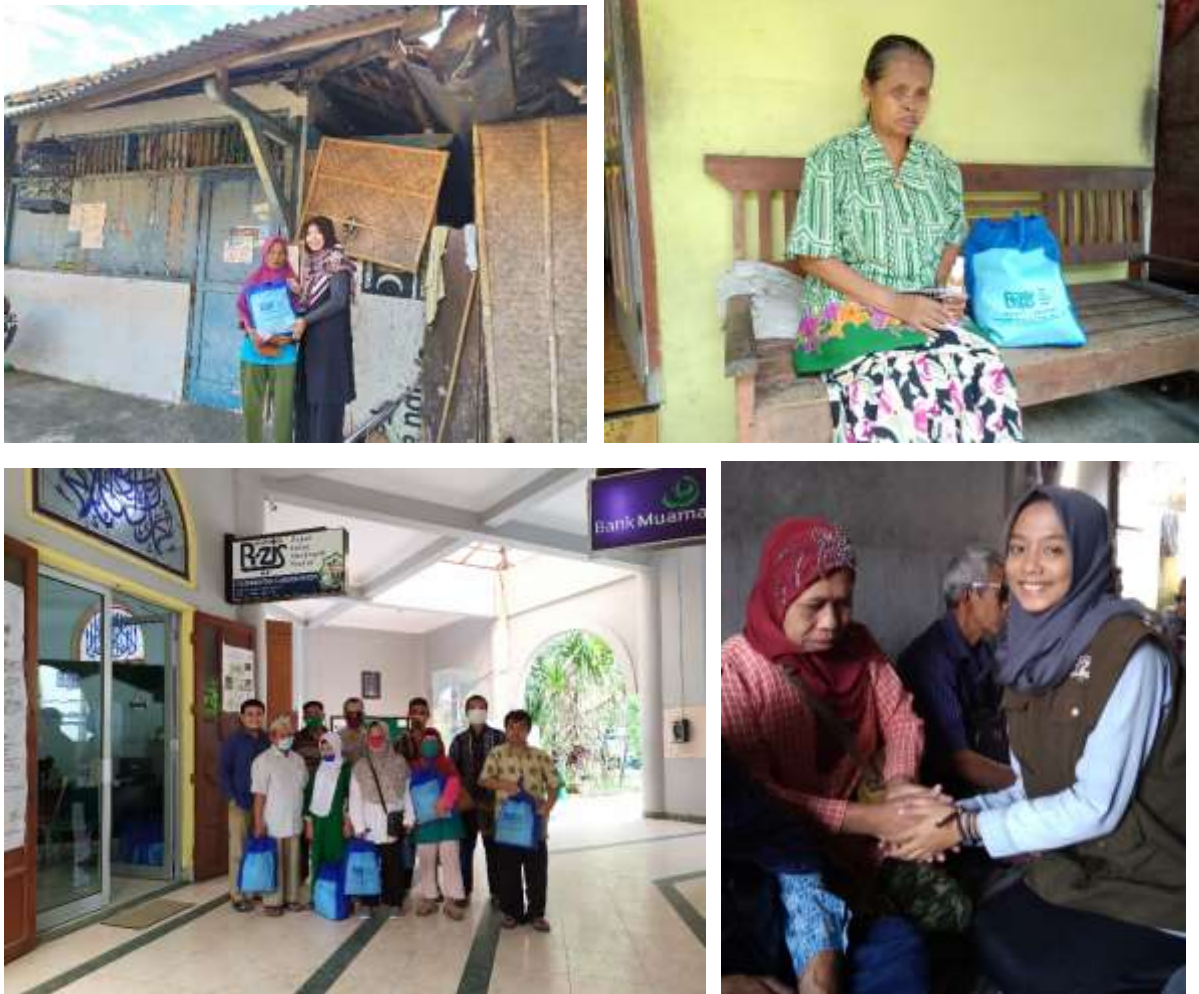
Gambar 1.4 Penyaluran Sembako dan Santunan Tunanetra