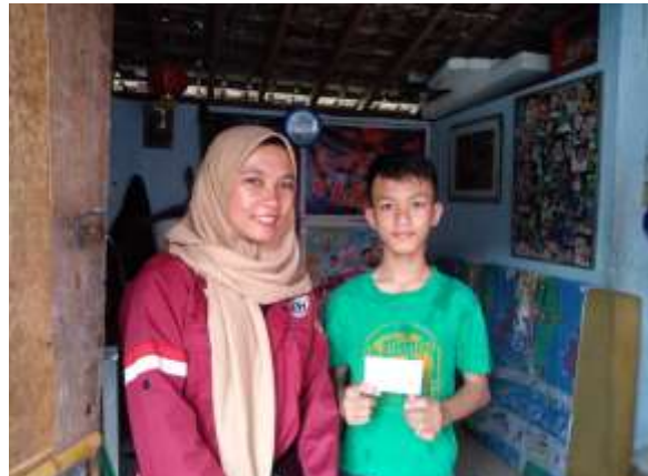
Gambar 1.5 Penyaluran Sembako dan Santunan Tunadaksa