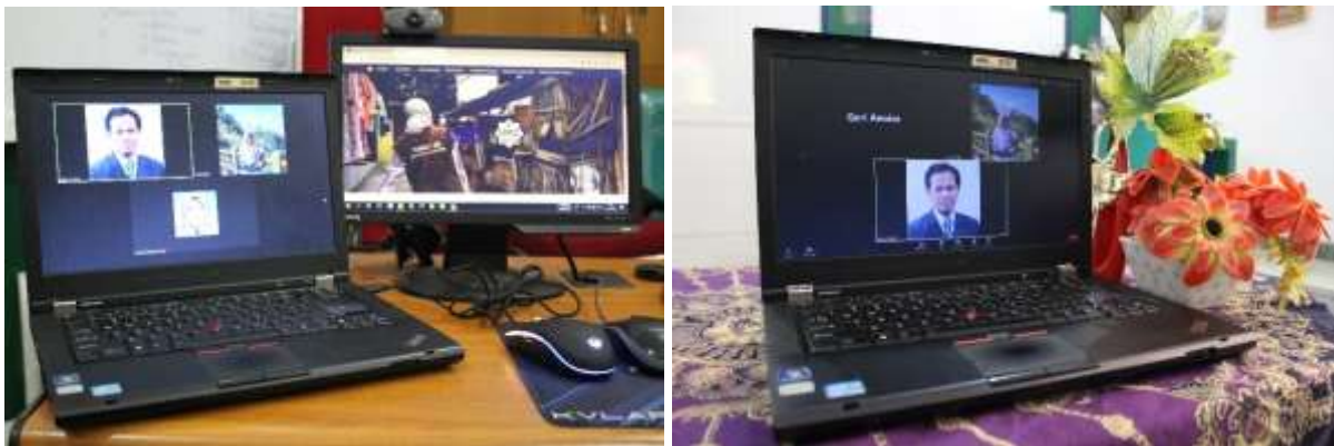
Gambar 1.16 Seleksi Wawancara Calon Penerima Beasiswa Secara Daring

Selama pandemi COVID 19, penerima beasiswa R-ZIS UGM yang tidak berada di Yogyakarta diberikan tugas via daring. Tugas tersebut diberikan dalam kurun waktu bulan Maret-Agustus 2020. Substansi tugas yang diberikan meliputi, posting agenda R-ZIS UGM di media sosial masing-masing penerima beasiswa, menghubungi alumni-alumni penerima Beasiswa R-ZIS UGM maupun civitas akademica UGM untuk bergabung menjadi muzaki maupun donatur pelbagai kegiatan R-ZIS UGM, khususnya beasiswa sekaligus pembaharuan ( update ) data.