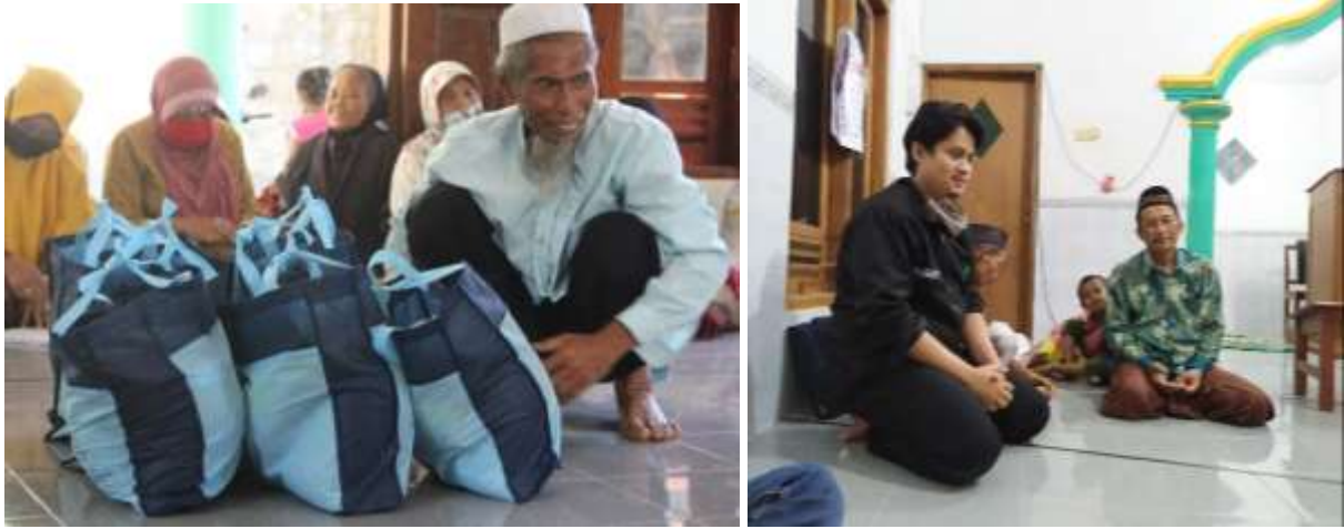
Gambar 1.6 Penyaluran Sembako dan Santunan Muallaf Minggir