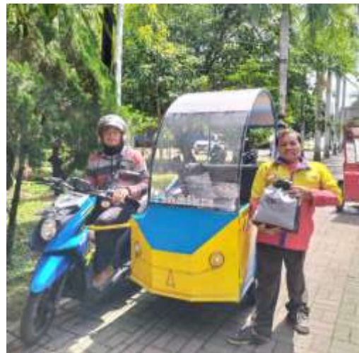
Gambar 1.9 Penyaluran Sembako Untuk Tukang Becak Difabel DIY