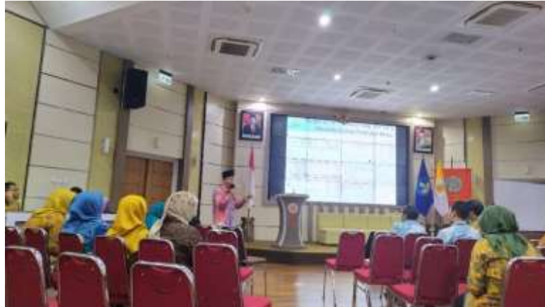
Gambar 1.8 Sosialisasi Zakat di Fakultas Ekonomika dan Bisnis UGM