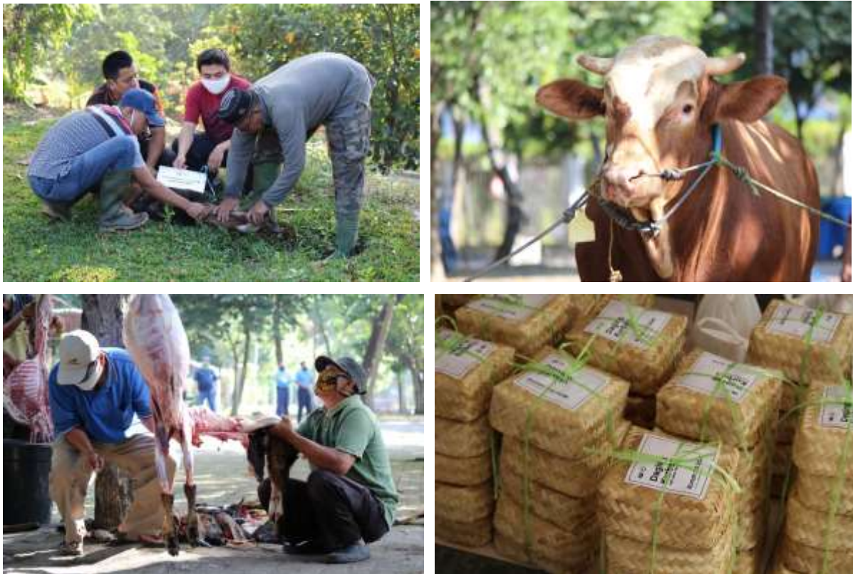
Gambar 1.15 Dokumentasi Penyembelihan Hewan Kurban di Masjid Kampus UGM