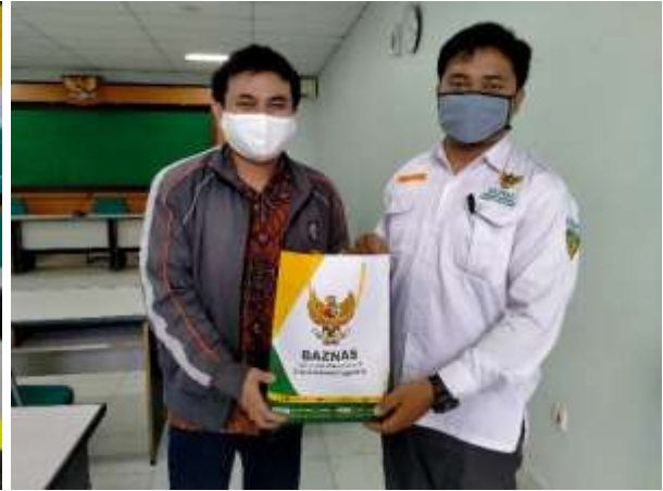
Gambar 1.17 Rapat Koordinasi Penyusunan RKAT 2021