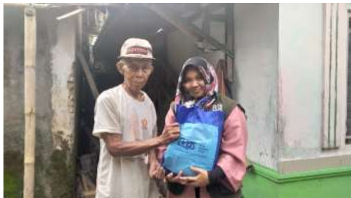
Gambar 1.3 Penyaluran Sembako Dhuafa Sekitar UGM