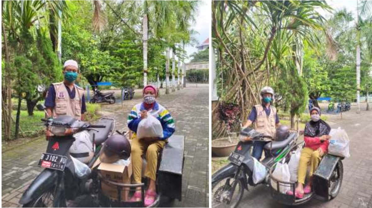
Gambar 1.10 Penyaluran Sembako COVID-19 untuk Difabel Turi