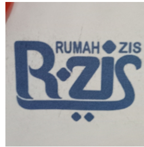
Kop Tata Tertib Staf