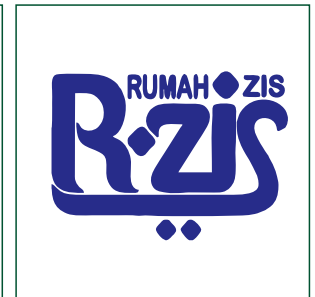
Desain logo yang ada di komputer