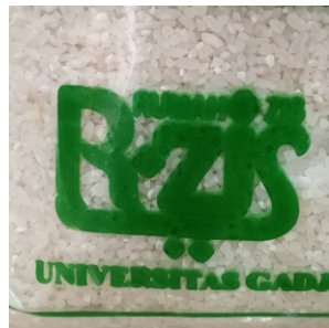
Plastik Beras Zakat Fitrah