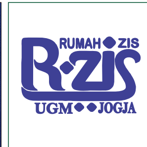
Desain logo yang ada di komputer