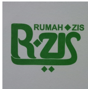
Kop Surat & Sampul surat